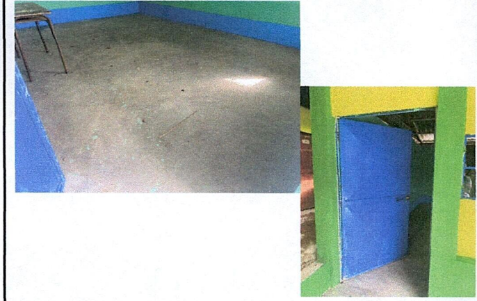
Foto 3: MEJORAMIENTO DE LOSA DE PISO (TIPO TORTA) E INSTALACION DE PUERTAS Y VENTANAS.