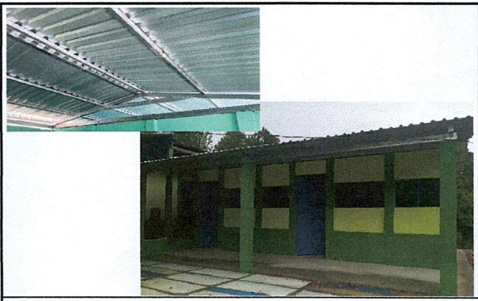
Foto 2: MEJORAMIENTO DE ESTRUCTURA TIPO PORTICO E INSTALACION DE LÁMINAS TROQUELADAS CAL. 26.