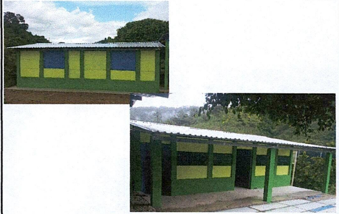
Foto 4: MEJORAMIENTO DE ESTRUCTURA TIPO PORTICO E INSTALACION DE LÁMINAS TROQUELADAS CAL. 26. Y MEJORAMIENTO DE LOSA DE PISO (TIPO TORTA) E INSTALACION DE PUERTAS Y VENTANAS

Observación: Si es necesario se pueden agregar hojas adicionales y actualizar el número de hojas.